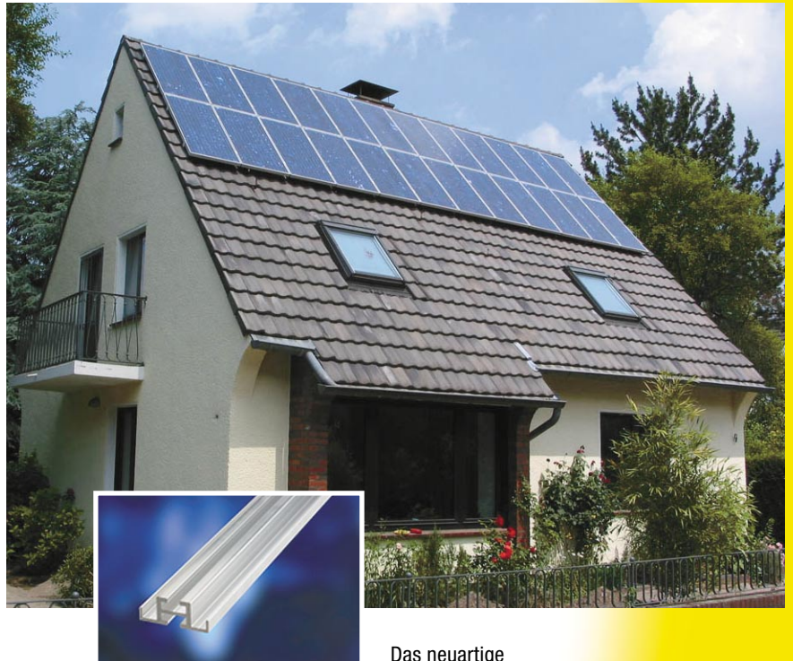
Das neuartige ECONSTRUCT Trägerprofil

Mit ECONSTRUCT entscheiden Sie sich für modernste Technik, höchste Material-Qualität und beispielhaftes Design.